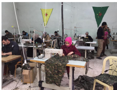
Один из швейных кооперативов Рожавы

Огромное значение революции придают освобождению женщин: впервые они получили равные с мужчинами права, стали занимать руководящие должности, в том числе в ополчении, и освободились от тирании мужчин, столь обычной для Ближнего востока. Против ИГИЛа сражается также женское ополчение YPJ, в котором состоит около 10 тысяч женщин. Население Рожавы, по разным оценкам, - от 2 до 4,5 млн. человек.